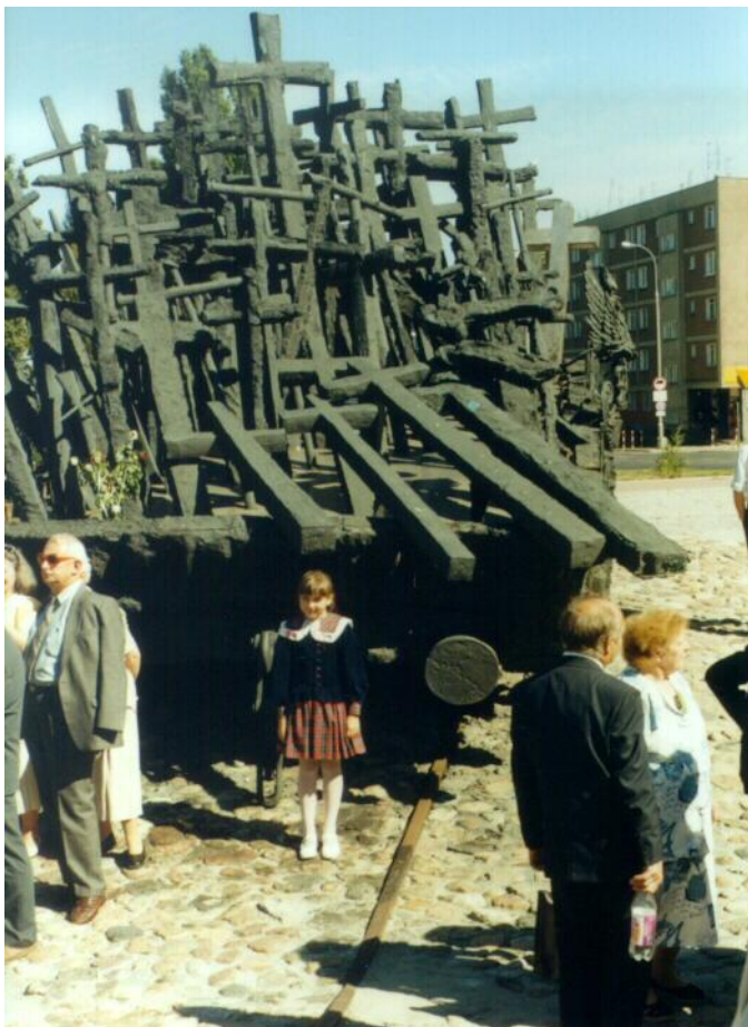
Uczestnicy Zjazdu przed pomnikiem Poległych i Pomordowanych na Wschodzie