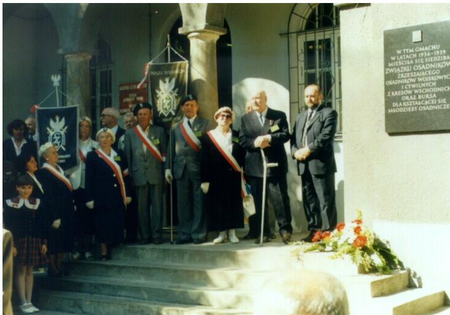
Złożenie wiązanki pod tablicą na budynku przy ul. Myśliwieckiej. Mieściła się tutaj w latach 1936-39 siedziba Związku Osadników i bursa dla młodzieży osadniczej