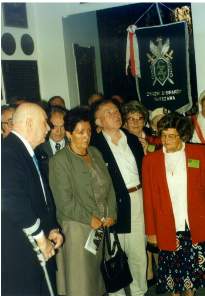
Przed tablicą poświęconą osadnikom. Katedra Polowa Wojska Polskiego

zjazdu umożliwiono odpłatnie (po niskich kosztach) skorzystanie z zakwaterowania w hotelach kompleksu uczelnianego oraz zespołu obiektu żywienia, zgodnie z naszymi propozycjami co do jadłospisu - posiłki były smaczne, należycie przyrządzone.