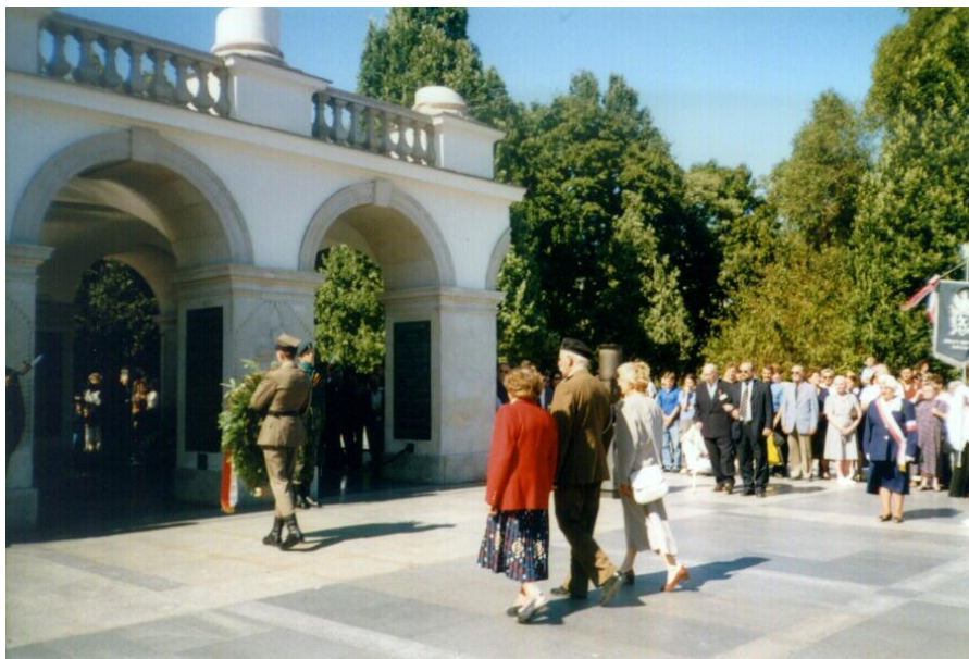
Składanie wieńca przed Grobem Nieznanego Żołnierza