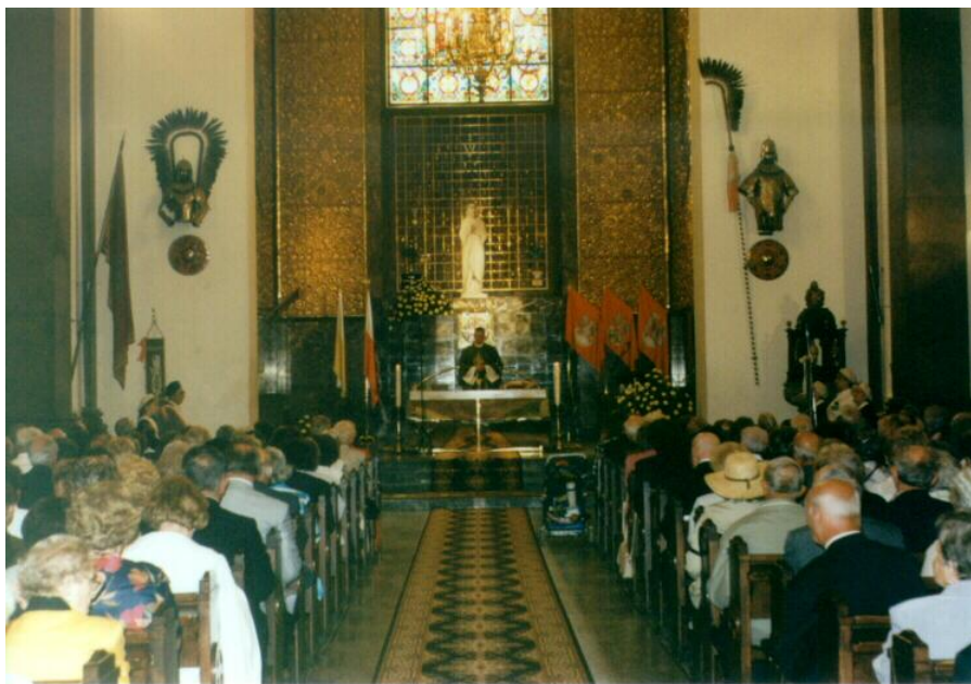
Msza święta w Katedrze Polowej Wojska Polskiego

Niestety, nie możemy zamieścić (nawet jako wyjątki) wielu listów - brak możliwości, załujemy, lecz miłe słowa i życzliwe serce dodają nam otuchy, zapamiętamy, dziękujemy.