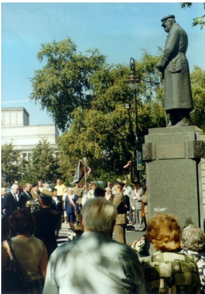
Składanie wiązanki kwiatów przed pomnikiem Marszałka Józefa Piłsudskiego