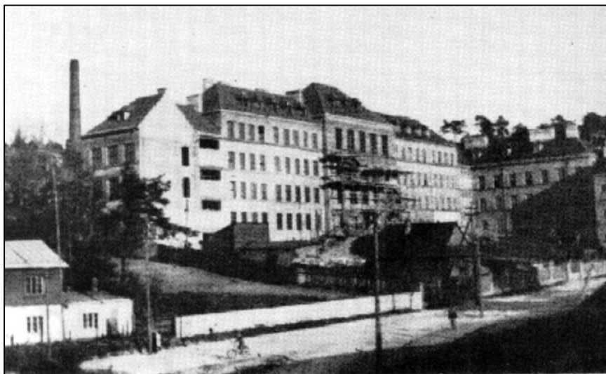
Budynek Państwowej Szkoły Technicznej im. J. Piłsudskiego w Wilnie

Wracam z duszą na ramieniu. Na szczęście pociąg nie ogrzewany, niektóre okna na korytarzu wybite, więc wszyscy siedzą w paltach, okryciach. Kolejarze jeszcze nasi, więc kontrole są stosunkowo łagodne. Mnie ułatwia przejazd wileńska legitymacja szkolna - jadę się uczyć do Wilna.