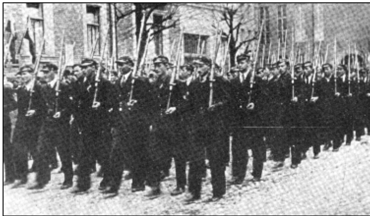
Defilada PW w 1938 r.

Pułkownik pytał dalej: czy będzie tylko to, co jest na tym papierze? Potwierdziłem, że