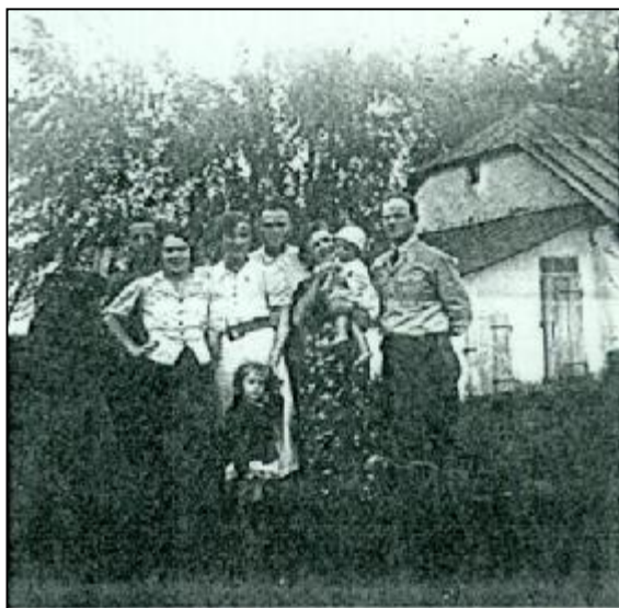
Najbezpieczniej w objęciach Mamy