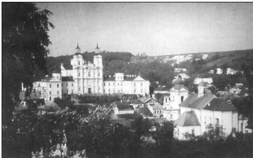
Krzemieniec. W głębi gmachy Liceum

Liceum dysponowało największą w Krzemieńcu i najlepiej wyposażoną salą