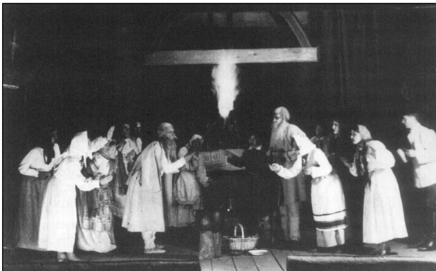
„Dziady” w inscenizacji młodzieży