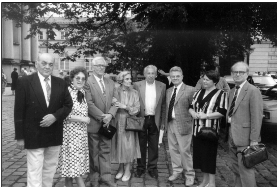
Grupa krzemieńczyków przed kościołem SS Wizytek. W oczekiwaniu na doroczną mszę św. w lipcu 1966 r

dzili ci, którzy tych szkół już nie zdążyli ukończyć, a także wychowankowie innych polskich szkół w Krzemieńcu. W powiecie krzemienieckim było wiele osad wojskowych, a także miejscowości częściowo zamieszkałych przez Polaków. W straszny czas mordów ukraińskich na Wołyniu i Podolu w latach 1942 - 1944 rodziny te ścigały do Krzemieńca w poszukiwaniu jakiegokolwiek schronienia. Wiele tych osób znalazło się po wojnie w Warszawie ze swoim bagażem wspomnień. Niektórzy z pośród nich stali się członkami naszego koła. Są też w nim takie osoby, które wyjechały z Krzemieńca jako małe dzieci, lub też nigdy w nim nie były, ale z tradycji