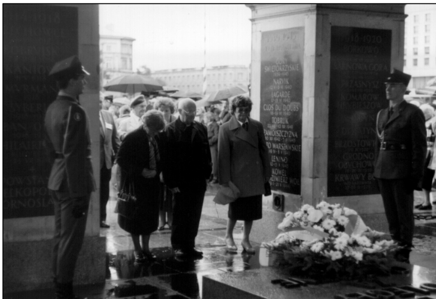
Składanie kwiatów przy Grobie Nieznanego Żołnierza

Obecnie wielkimi krokami zbliża się nasz kolejny zjazd. Tym razem organizujemy go my - potomkowie Osadników Kresowych zamieszkali w Polsce.