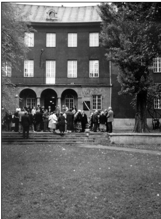
Przed dawnym Domem Osadniczym

W dniach 16-17 września 1995 odbył się Pierwszy Światowy Zjazd Rodzin Osadników Wojskowych z dawnych Kresów Polski.