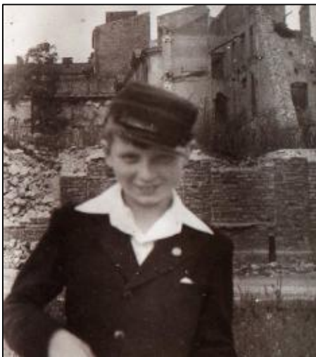
Jestem uczniem Szkoły Górskiego (gdzieś w śródmieściu Warszawy, jesień 1945)