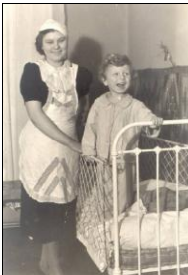
Z Jasią na Chłodnej (1939)

Aby lepiej zobrazować tło moich przeżyć w okresie wczesnej jesieni 1944 roku powinienem jednak cofnąć swoje wspomnienia do roku 1939 i do napaści Niemców na Polskę.