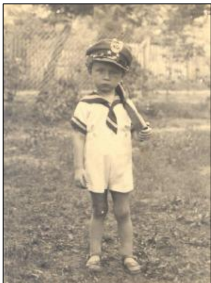
Lato 1939 r. w Radości