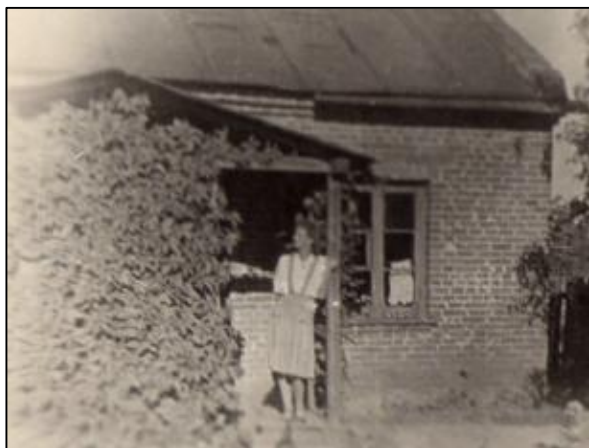
Mama przed domkiem w Żabieńcu, w którym prze- trwaliśmy zimę 1944/1945