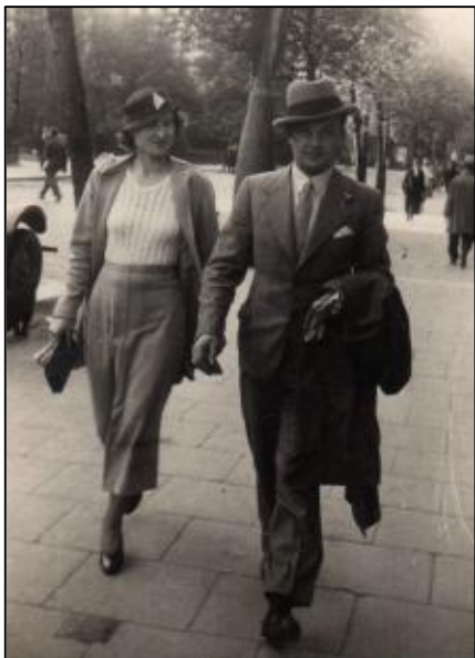
Moi rodzice w Alejach Ujazdowskich (połowa lat trzydziestych)

Ktoregoś wieczoru zabrałem się do czytania Plusa Minusa , weekendowego dodatku do Rzeczpospolitej . Nie chciałbym w tym miejscu wyróżnić ktoregokolwiek z wielu moich ulubionych autorów, ale zrobię jeden, oko-