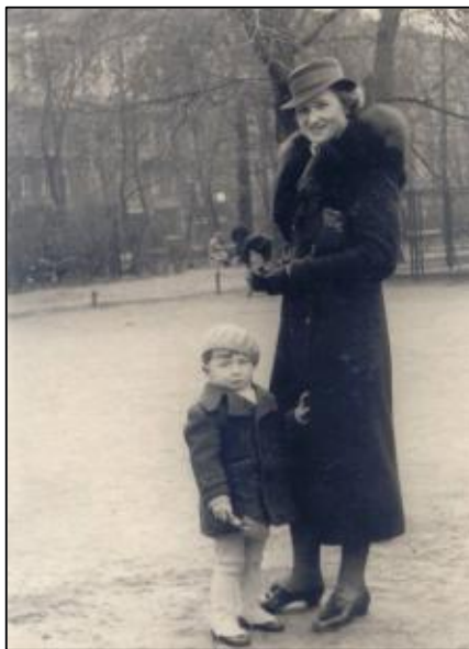
Z mamą w Ogrodzie Saskim

Niemcy odkryli szybko nasz rów przeciwlotniczy i ustawili nas przed nim w dwóch rzędach. Postawili też przed nami na ziemi dwa karabiny maszynowe z załadowanymi taśmami. Stałem prawie na środku trzymając się rąk mamy i Helenki. Płakało wiele kobiet i dzieci. Mama wspominała później, że zadałem jej pytanie: „Mamusiu, co z nami robią?”. A moja biedna, oszołomiona mama zapominając, kto i o co ją pyta, odpowiedziała bezradnie: „Chyba nas, synku, rozstrzelają”. Uratowało nas piekło, które rozpełtało się w pewnej odległości w kierunku Zalesia. Nagle błyski i huk wybuchów (chyba granatów?), jakaś bezładna strzelanina i serie z broni automatycznej. Dostrzegłem zdenerwowanie i lęk w zachowaniu Niemców. Kazali nam wszystkim położyć się twarzami do ziemi, pozostawili z nami dwóch czy trzech na straży, a wszyscy inni pobiegli, z przygotowaną do strzału bronią, w kierunku leśnej gęstwiny. Dowiedzieliśmy się później, że jakimś oddziałowi leśnemu udało się wtedy przebić przez pierścień okrążenia i stąd całe zamieszanie wśród Niemców, które być może uratowało nam życie. Jeszcze później dotarła wiadomość, że pacyfikację lasów chojnowskich dokonywali Niemcy siłami całej dywizji, używając do tego celu samolotów zwiadowczych, wojsk zmotoryzowanych, artylerii oraz pociągu pancernego z linii radomskiej. Ale wówczas nie wiedzieliśmy nic o tych sprawach, podobnie jak o losie taty.